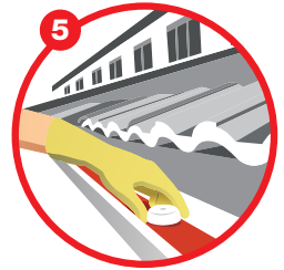
5 Clear the roof gutter and place Bti insecticide Bersihkan alur bumbung dan bubuhkan racun serangga Bti