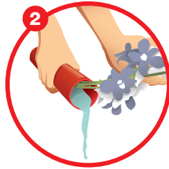
2 Tip the vase Buangkan air pasu bunga