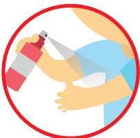
Apply insect repellent Sapukan ubat penghalau serangga