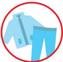
Wear long-sleeved shirts and pants Pakai baju berlengan panjang dan berseluar panjang