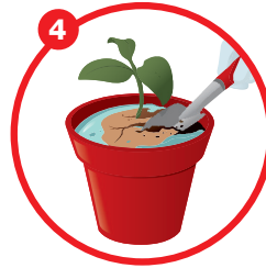
4 Loosen the hardened soil Gemburkan tanah yang keras