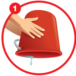
1 Turn the pail Telungkupkan bekas air

Hapuskan takungan air di rumah untuk melindungi keluarga dan kejiranan kita: